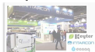
Grupo KEYTER INTARCON GENAQ novedades en refrigeración