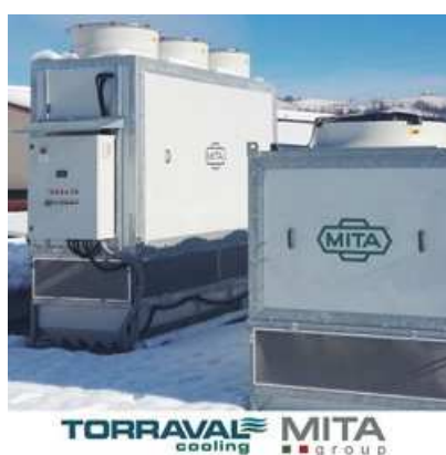
Torraval presenta un caso práctico de una actualización de un sistema de refrigeración en una lechería de Italia.