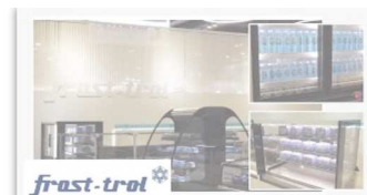
Frost-trol - Novedades en refrigeración comercial - Feria