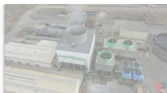
Restauración de una torre de refrigeración o enfriamiento de