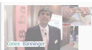
Novedades de CONEX BÄNNINGER en accesorios de cobre - Feria